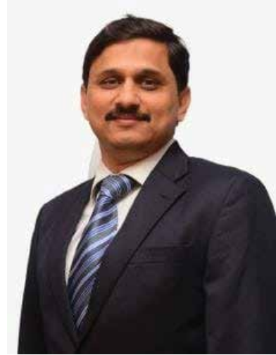
District Director- Membership Development

२०. सेवा करण्याची संधी रोटरी हा एक सेवा क्लब आहे. त्याचा व्यवसाय म्हणजे मानवजात आहे. त्याचे उत्पादन सेवा आहे. रोटेरियन स्थानिक आणि आंतरराष्ट्रीय अशा दोन्ही समुदायांना सामुदायिक सेवा पुरवतात. रोटेरियन बनण्याचे कदाचित हेच सर्वात चांगले कारण आहे: काहीतरी वेगळे करण्याची आणि त्या प्रक्रियेत येणाऱ्या आत्मपूर्तीची जाणीव होण्याची आणि त्या समाधानाची परतफेड स्वतःच्या जीवनात करण्याची संधी. हि भरपूर आत्मसुख देणारी भावना आहे.